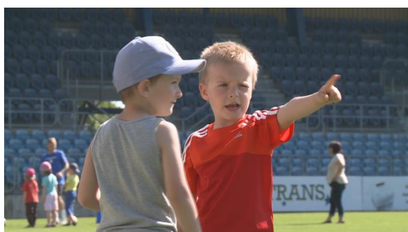
Nábor dětí do SFC Opava