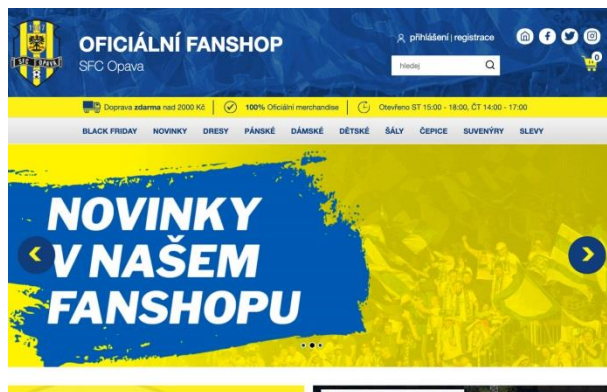
Fanshop SFC Opava