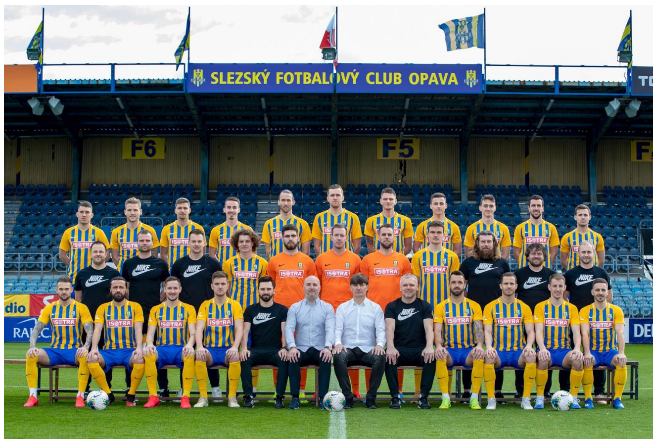
A tým SFC Opava SR 2019/2020 - FORTUNA:LIGA