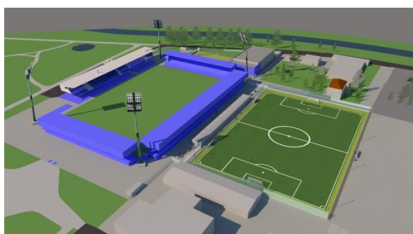
Rozvoj sportovišť SFC Opava