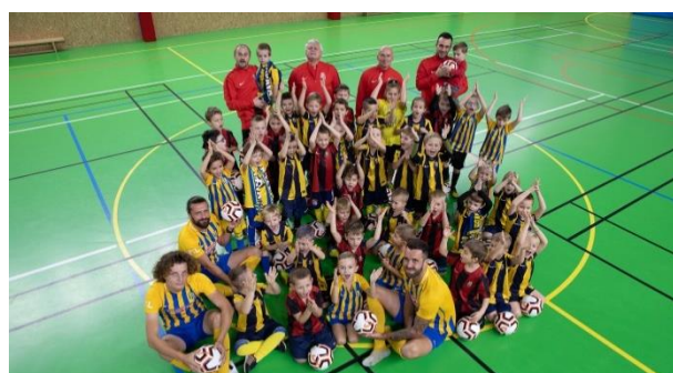
Mládež SFC Opava