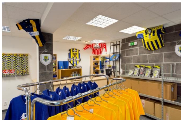
Fanshop SFC Opava